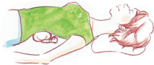
腰・背中へのケアに