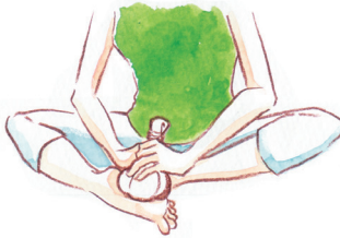
脚・膝へのケアに